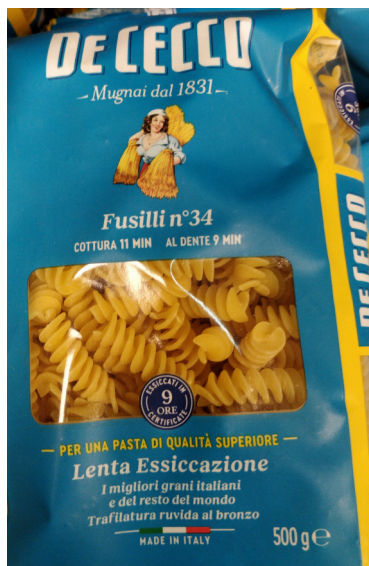
← Figur 1. Fusilli.