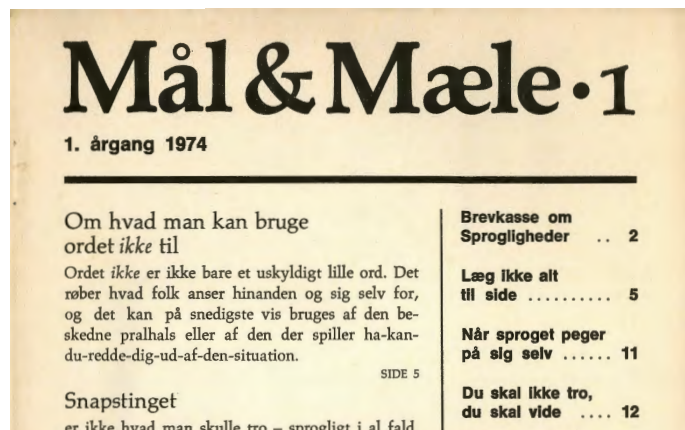
Figur 1. Udsnit af første side af første nummer af første årgang af Mål og Mæle .