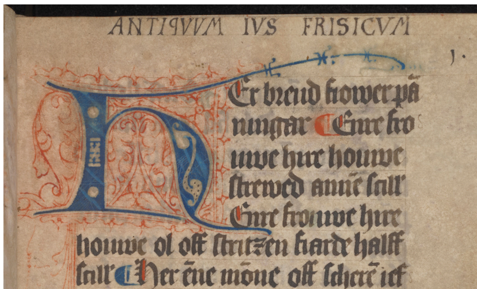
Figur 1. Begyndelsen på et oldfrisisk lovhåndskrift, det såkaldte 3. Emsingo-håndskrift fra midten af 1400-tallet. Håndskriftet stammer oprindeligt fra området omkring Emden i det nordvestlige Tyskland, men befinder sig i dag på arkivet Tresoor i Leeuwarden i Holland. Teksten er skrevet på oldfrisisk, men øverst på siden har nogen tilsyneladende ment at det var nødvendigt at tilføje en forklaring på latin: ANTIQUUM IUS FRISICUM 'den gammel frisisk lov'.

Holland i 1515. Disse politiske forandringer fik også sproglige følger, både i forhold til det skrevne og det talte sprog.