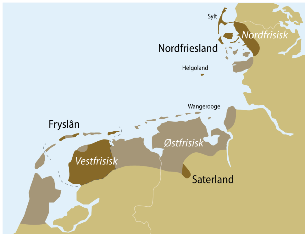
Figur 3. Kort over de frisisktalende områder i Holland og Nordtyskland i dag (de brune områder) og i middelalderen (de grå områder). Som det ses, er Saterland i Tyskland den sidste rest af et oprindeligt meget større østfrisisk område. Illustration: Wikimedia Commons, modificeret af Bo Nissen Knudsen.