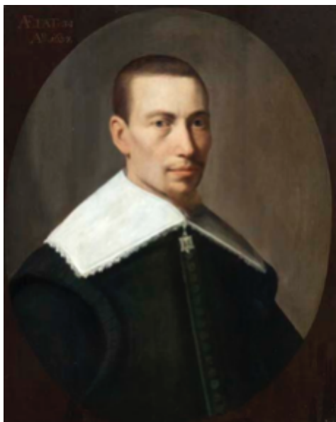
Figur 2. Portræt af Gysbert Japicx fra 1637 af den vestfrisiske maler Matthijs Harings (1593–1667). Maleriet hænger i dag på Fries Museum i Leeuwarden. Gysbert Japicx gælder ikke blot som en af de vigtigste skikkelser i frisisk litteraturhistorie, men også som ophavsmand til det moderne vestfrisiske skriftsprog. Han havde dog kun begrænset succes i sin egen levetid, og hovedværket Friesche Rymlerye (»Frisisk rimeri«) fra 1668 blev først udgivet efter hans død.

nordfrisiske tekster er to parallelle oversættelser – til to forskellige dialekter – af Luthers lille katekismus. De befandt sig tidligere i et håndskrift i stadsbiblioteket i Königsberg (nu Kaliningrad), men dette håndskrift menes at være gået tabt under 2. verdenskrig. Heldigvis findes der en afskrift af oversættelserne, så vi stadig kan studere dem i dag. Her er et eksempel fra udlægningen af det syvende bud: