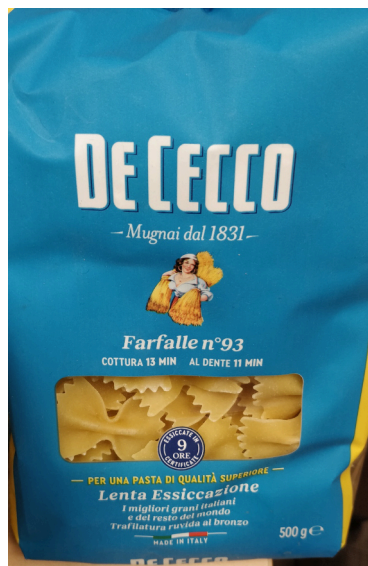
Figur 2. Farfalle. →

man spinder. Så fusilli betyder ›små tene‹.